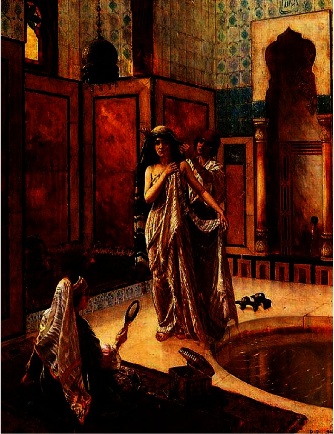
حريم الحمام لأرنست.