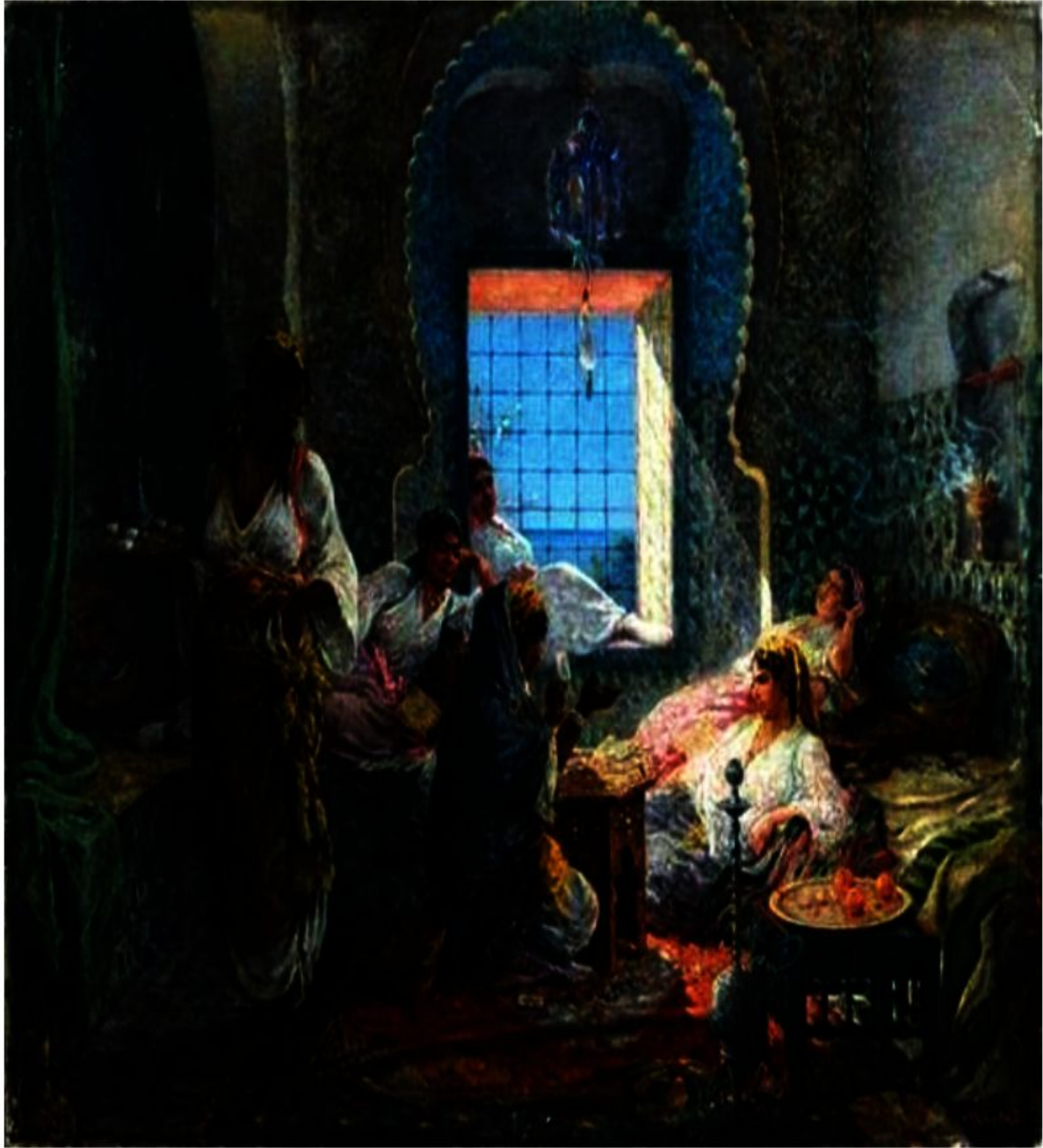
متنبّة الورق لشاتو.